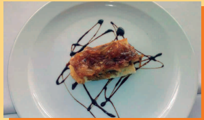
Secreto ibérico con foie y cebolla confitada