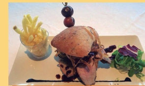
Mil hojas de Bea

C/ Joaquín Sorolla, 1-Esq. Paseo de la Constitución - Águilas