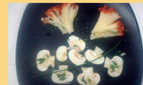
Flores de queso con champiñón al aceite de limón

C/ Blas Rosique, 6 bj. - Tel. 968 411 798 - Águilas