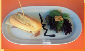
Bocadito de Chussi horneado