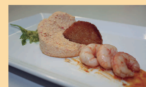
Esponjoso de Roca con gamba al ajo