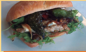
Bocadito Delicia de Secreto