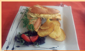
Bocadito de París