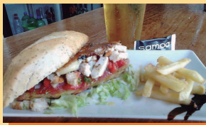
Pollo a la vinagreta trufado