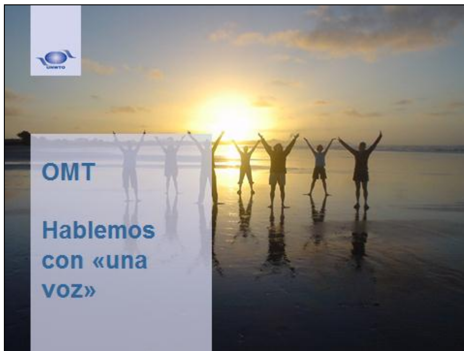
Imagen institucional de la OMT