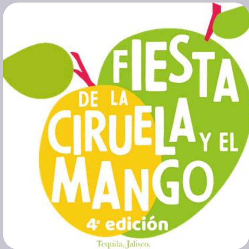
FESTIVAL DE LA CIRUELA Y EL MANGO.