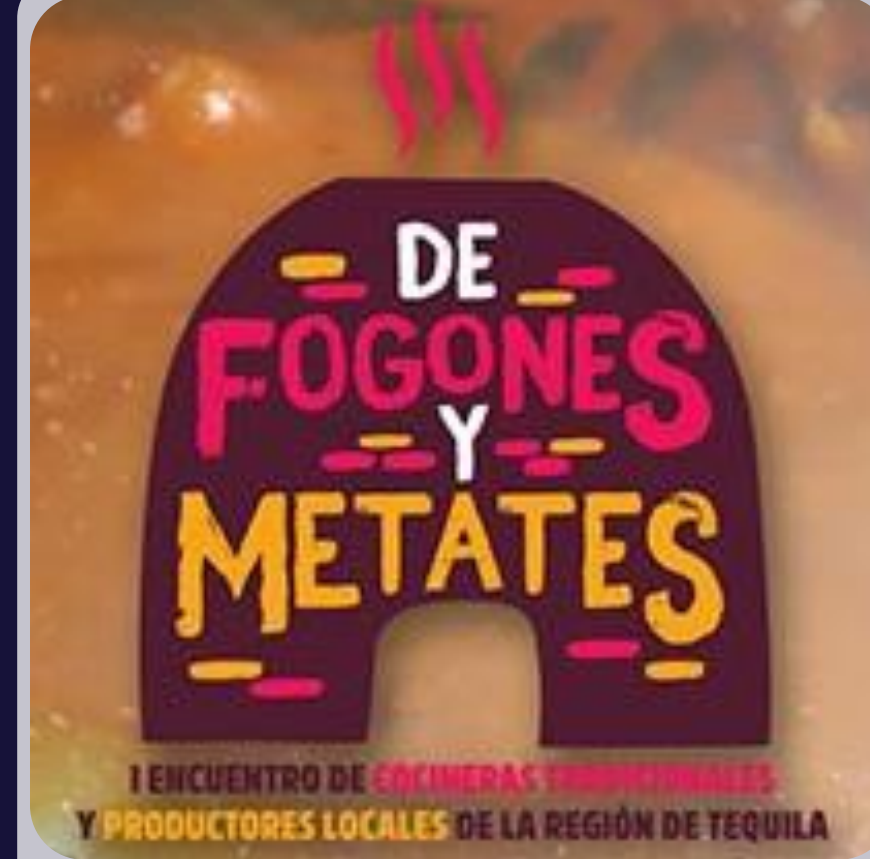
DE FOGONES Y METATES, COCINA TRADICIONAL MEXICANA.