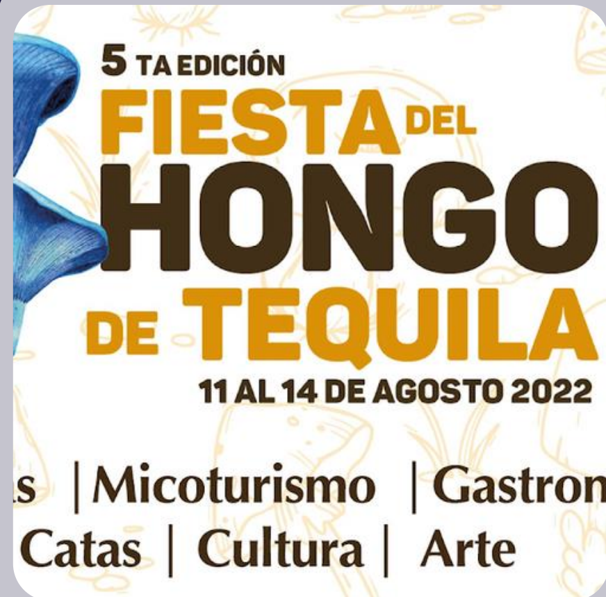
FIESTA DEL HONGO DE TEQUILA.