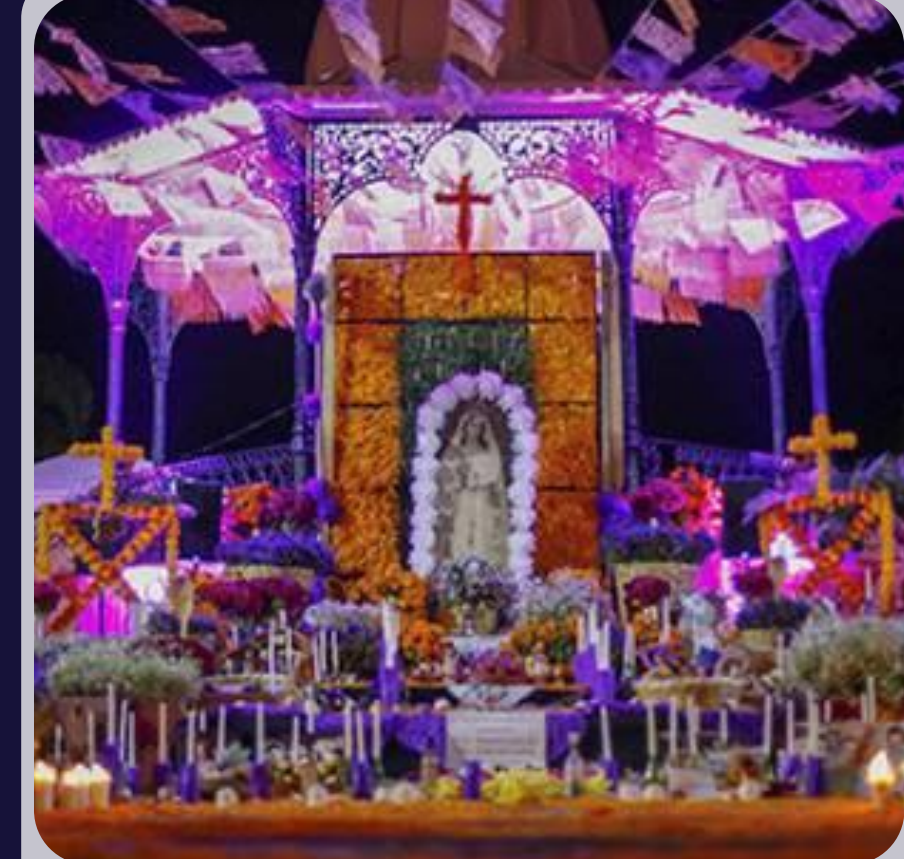
FESTIVAL DEL DÍA DE MUERTOS Y FERIA DEL PAN.